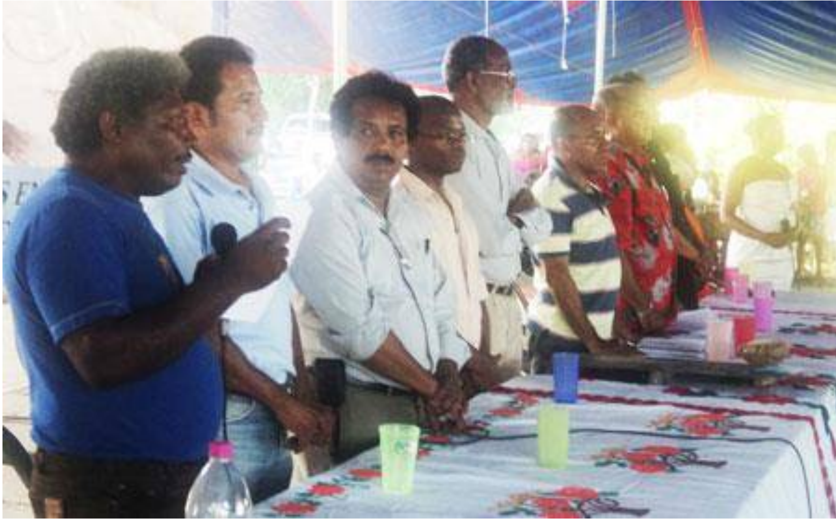
ENCUENTRO DE PUEBLOS NEGROS, CHARCO REDONDO, TUTUTEPEC, OAX. OCT-2011