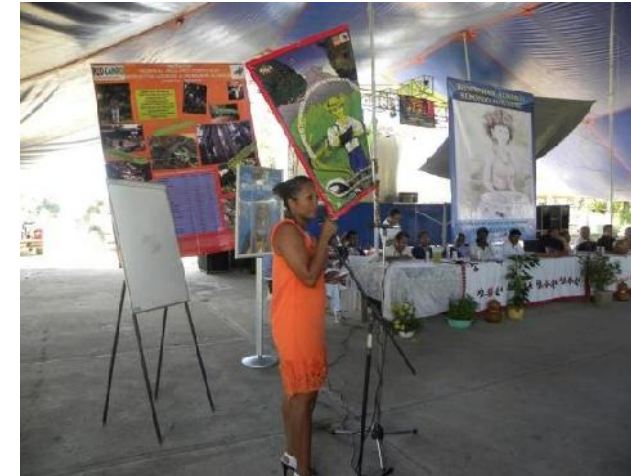
XII Encuentro de pueblos negros en Charco Redondo, Tututepec, Oax. 2011